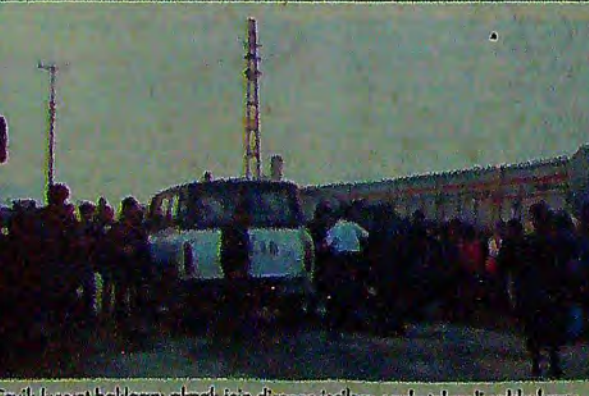
Çevik kuvvet haklarını almak için direnen işçilere coplu tekmele saldırılarını sürdürürken işçiler, "bir gün gelecek bu fabrikayı başınıza yıkacağız" diye haykınıyordu

"Birgün gelecek bu fabrikayı başınıza yıkacağız". Bu sözler çevik kuvvet polislerinin coplu, tekmele, tokatlı saldırısından kendisini kurtarabilmiş bir Segura Tekstil işçisine ait. Bu sözler söylendiği sırada da çevik kuvvet fabrikayı "kurtarmış" olmanın rahatlığıyla gözaltına aldığı işçileri doldurduğu arabalarla birlikte üssüpe geri döndüyordu. Segura Tekstil, Kars'ta, Güney Kore-İtalyan sermayesiyle 11 ay önce kurulmuş bir fabrika. Fabrikada çoğunluğunu 18-20 yaşlarında kadınlardan oluşan 420 işçi çalışıyor (du). Ücretler ise 250 bin ile 400 bin arasında değişiyordu. Kuruluşundan bu yana düşük ücretle sendikası ve sağlıksız çalışma koşullarına katlanan Segura işçileri, ilk eylemlerini 1 Mart 91 tarihinde, işverenin 2 günlük ücretlerini kesmesi üzerine, bir gün iş bırakarak gerçekleştirdiler. (Devamı 7. sayfada)