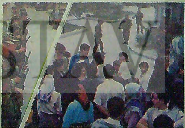
Jandarmanın saldırısı sırasında "işimiz, aşımız, terketmeyeceğiz" diye haykaran işçiler dipçiklerle dövülerek susturulmaya çalışıldı.

SASTAŞ İŞÇİLERİNİN CEVABI: "İŞİMİZ, AŞIMIZ, TERKETMEYECEĞİZ" Sastaş işçileri birinci yolu seçtiler; işten atılma, atılmayana ulaşabildikleri geniş katımlı toplantılar düzenle (Devamı 7. sayfada)